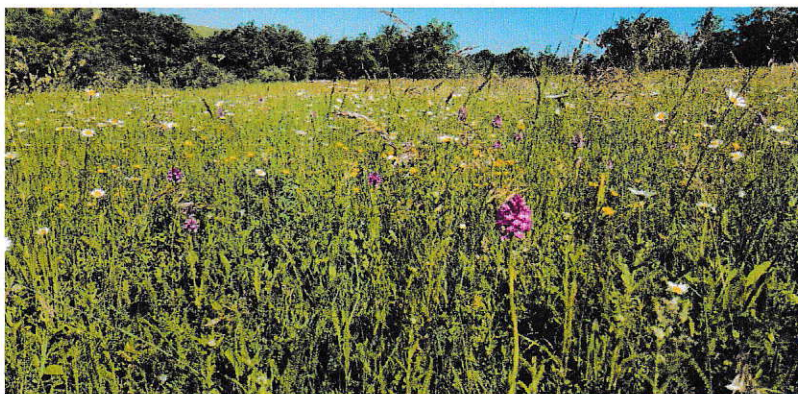
Figure 1: Champ sur abond projet plu 2021

Dans la liste des espèces végétales ne figurent pas des orchidées que j'ai repérées lors de mes promenades dans ce secteur.(qui n'est pas une déchèterie agricole)