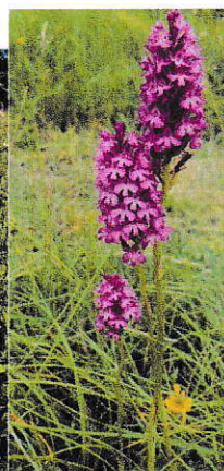
Figure 2 Orchidée 2020 sur projet PLU2021

A ce sujet ,je ne pourrais plus me promener sur ce site via le chemin de Baladas-Picard ? (Moi et d'autres)